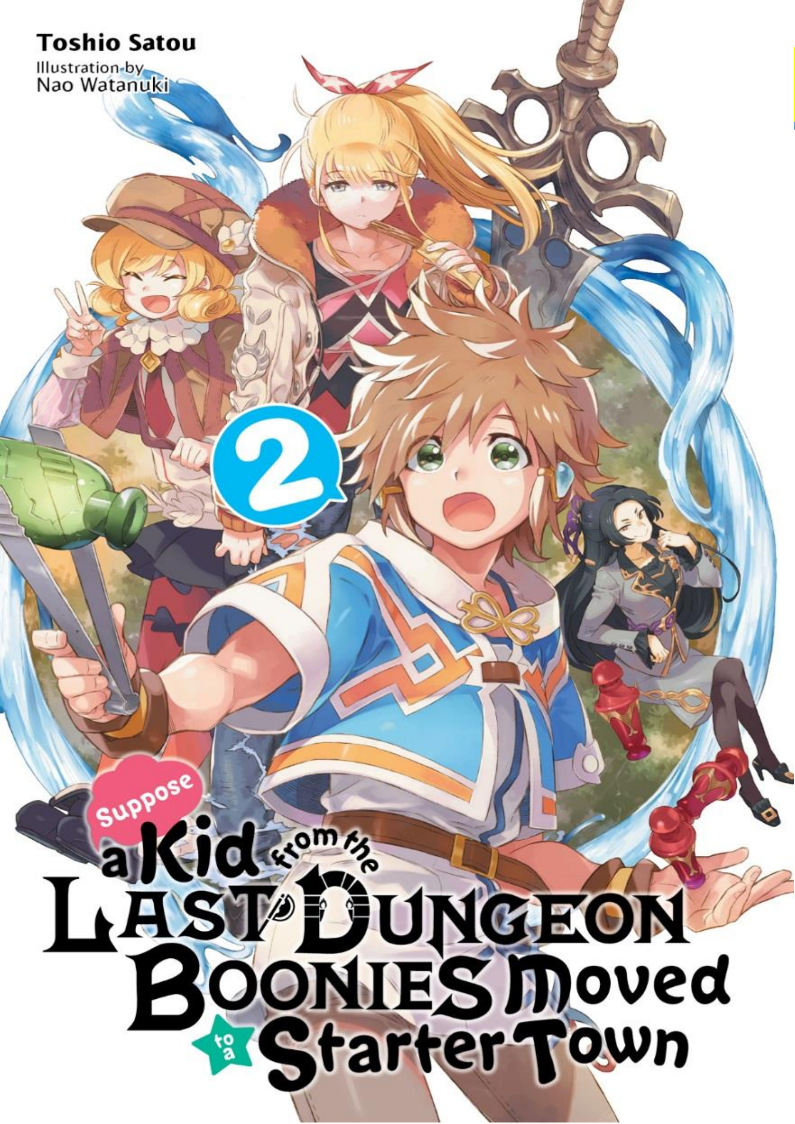
Illustration by Nao Watanuki