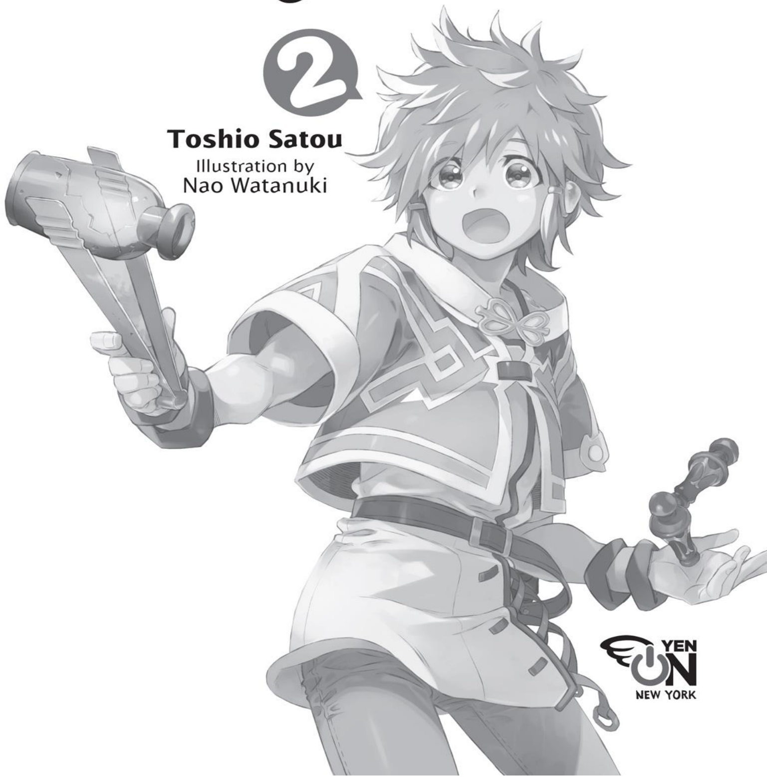
Illustration by Nao Watanuki