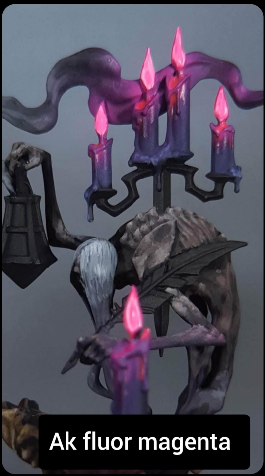
Ak fluor magenta