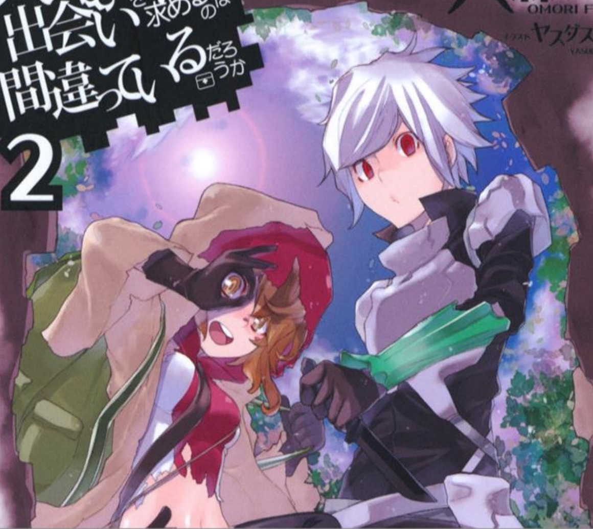
イラスト ヤスダスズヒト YASUDA SUZUHITO